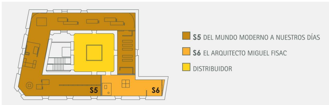
Imagen: plano de la planta alta del museo comarcal de Daimiel.

Nota: S6, espacio dedicado a Miguel Fisac y S5, Daimiel de la modernidad a la actualidad.