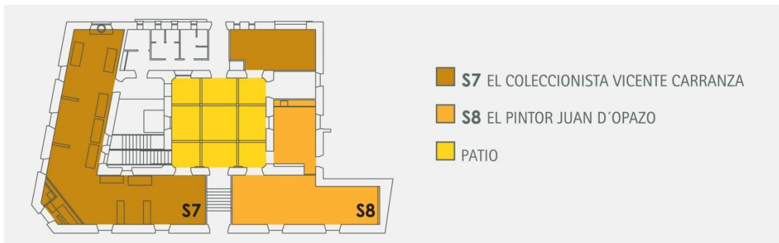
Imagen: planta baja del museo comarcal de Daimiel.