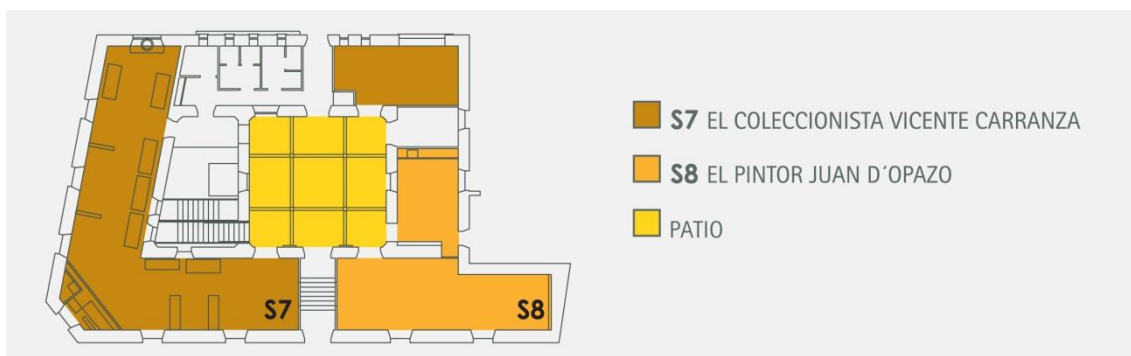
Imagen: planta baja del museo comarcal de Daimiel.