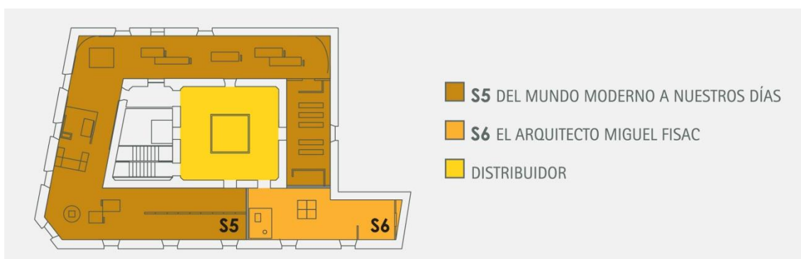
Imagen: plano de la planta alta del museo comarcal de Daimiel.

Nota: S5, Daimiel de la modernidad a la actualidad (visualización de la réplica de una quintería y de un molino hidráulico); S6, espacio dedicado a Miguel Fisac (expuesto en el documento de 4º ESO).